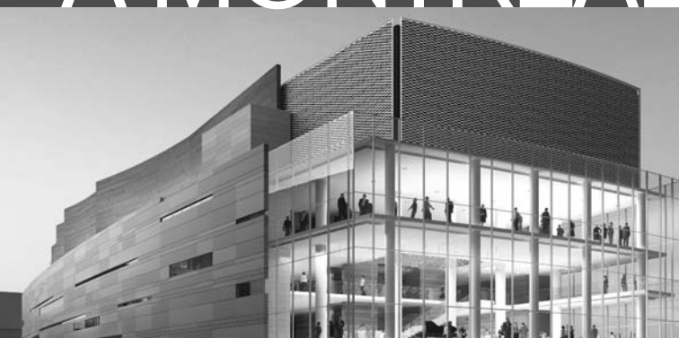
PLACE DES ARTS