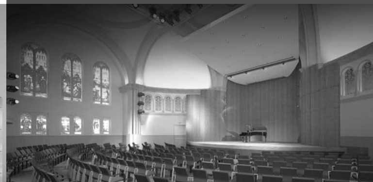
SALLE BOURGIE DU MUSÉE DES BEAUX-ARTS DE MONTRÉAL