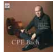
Truls Mork – Concertos pour violoncelle de C.P.E. Bach (VIRGIN CLASSICS)