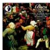
Cantates profanes de J.S. Bach vol. II (DORIAN)