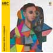
Glass/Handel (Decca Gold Universal Music)