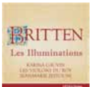
Britten, Les Illuminations (ATMA)