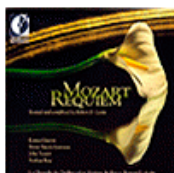
Requiem de Mozart (DORIAN)