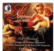
Simphonies des noëls (DORIAN)