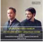
Mozart, Concertos pour piano (Analekta)