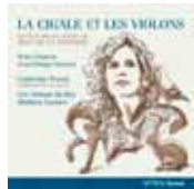
La Cigale et Les Violons (ATMA)