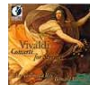
Concerti pour cordes de Vivaldi (DORIAN)