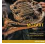
Mozart, Concertos pour cor (ATMA)