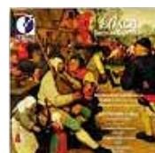
Cantates profanes de J.S. Bach, vol. I (DORIAN)