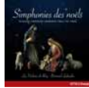
Simphonies des noëls (Réédition ATMA)