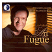
L'Art de la fugue de J.S. Bach (DORIAN)