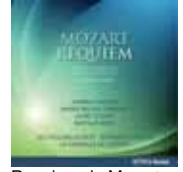
Requiem de Mozart (Réédition ATMA)