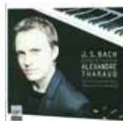
Alexandre Tharaud – Concertos pour clavier de J.S. Bach (VIRGIN CLASSICS)