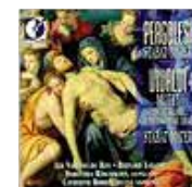
Stabat Mater (DORIAN)