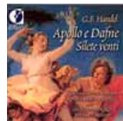
Apollo e Dafne de Handel (DORIAN)