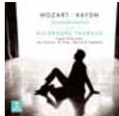
Alexandre Tharaud, Mozart, Haydn, Jeunehomme (ERATO)