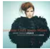
Airs d'opéras de Gluck, Haydn et Mozart