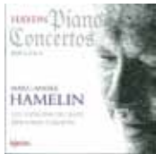
Concertos pour piano n° 3, 4 et 11 de Haydn (HYPERION)