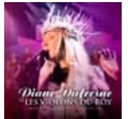
Diane Dufresne et Les Violons du Roy