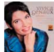
Vivica Genaux – Aires de Handel et Hasse (VIRGIN CLASSICS)