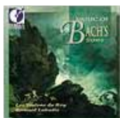
Musique des fils de Bach (DORIAN)