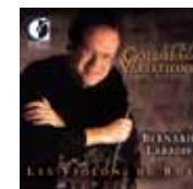
Variations Goldberg de J.S. Bach (DORIAN)