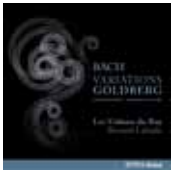
Variations Goldberg de J.S. Bach (Réédition ATMA)