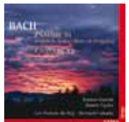
Psaume 51 et Cantate 82 de J.S. Bach (ATMA)